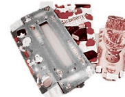
ティッシュなどの 紙箱