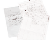
ダイレクトメール