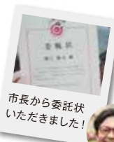
市長から委託状 いただきました!