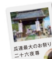
瓜連最大のお祭り 二十六夜尊