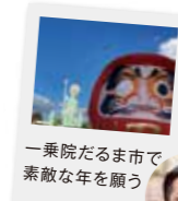
一乗院だるま市で 素敵な年を願う