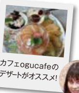
カフェogucafeの デザートがオススメ!