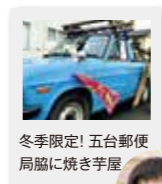
冬季限定! 五台郵便 局脇に焼き芋屋