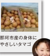
那珂市産の身体に やさしいタマゴ