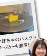
かぼちゃのバスクド チーズケーキ濃厚!