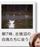
朝7時、古徳沼の 白鳥たちに会う