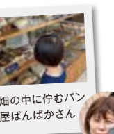
畑の中に佇むパン 屋はんばかさん