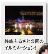
静峰ふるさと公園の イルミネーション!