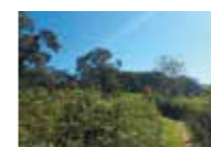
里山にも秋の訪れ木々も色づきはじまりました by 浜名