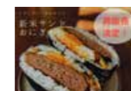
いい那珂マルシェで常陸牛ハンバーグのおにぎりを販売 by 事務局