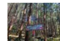
平野散歩道古徳沼周辺をハイキング by 平野清代