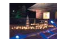
那珂市曲がり屋でライトアップを開催中