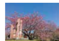
静峰ふるさと公園の八重桜満開です! by 事務局

いい投稿、ぞくぞく! 那珂市で気になるモノ、お知らせしたいコトなど、facebookやWEBマガジンに投稿しよう!