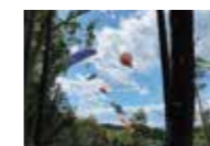
古徳沼にはこいのぼりも泳いでいます by 井澤清代