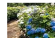
茨城県植物園のアジサイがキレイです by 事務局