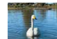
今年も那珂市に白鳥がやってきました! by 事務局