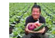
よみうりタウンニュースにいい那珂マルシェが紹介 by 小林慎行