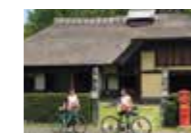
自転車で市内の名所巡り新しい発見があるかも! by 萩谷