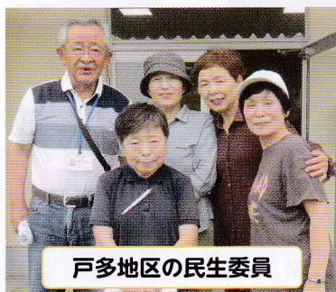
戸多地区の民生委員