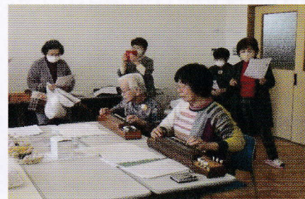
大正琴に 合わせて合唱