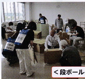
＜段ボールベッド作成＞