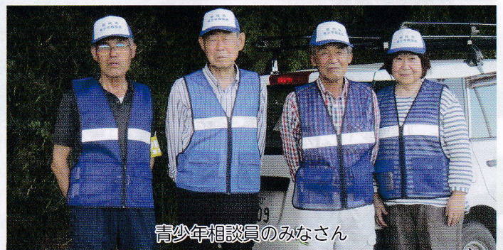
青少年相談員のみなさん