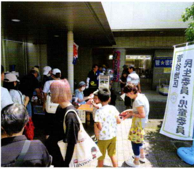
民生委員・児童委員の皆さんが提供する、かき氷、綿あめ、ポップコーンのコーナーが人気です

子供に人気のくじ引きコーナーや綿あめ、かき氷はもちろん、障がい者の自立支援事業などを行っている「ハートケアセンターひたちなか」さんの焼菓子販売や、那珂市フェルミエ会の「しどり園芸」「會澤農園」「綿引農園」さんにも出品協力をお願いいただき、大人の方にも嬉しいお花や地産野菜の販売を行いました。