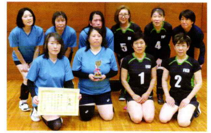
準優勝の中宿チーム(左側)と菅谷地区代表のFKDチーム

第66回那珂市スポーツ協会地区対抗大会が令和7年7月20日(日)なかLucKYFM公園・多目的広場及びアリーナで開催されました。