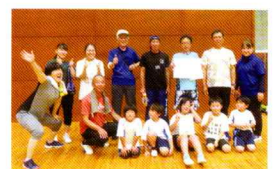
2位 寄居くまさんチーム