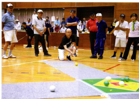
準優勝に輝いたかしま台チームのプレー

その中でも、かしま台チームはオーバルボールで準優勝となりました。今回は菅谷地区が優勝できるような皆さんの参加をお待ちしております。