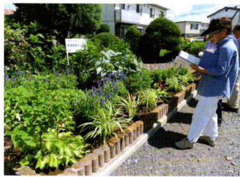
優秀賞 中宿愛宕ガーデン (菅谷中宿自治会)