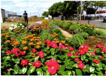
優秀賞 いきいきサロン日の出会 (東組自治会)

地域の美化活動は公共の場を彩り住民や訪れる人々を和ませます。と同時に、自然や緑の大切さ、花や植物を育てる楽しさという美の創造性を通して地域の人々をつなぐ大切なイベントです。花壇づくりを通じて自然を慈しむ心や協力する喜びを育み、地域全体に活気と彩りをもたらしたいと考えています。