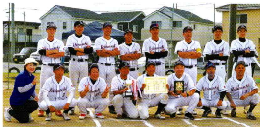
那珂市の代表として9月28日(日)の県大会に出場した一の関ソフトボールクラブ。素晴らしい活躍で、栄えある準優勝に輝きました。