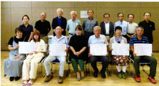
受賞された皆さん

式後の懇談では花壇のデザインや植栽の工夫、チームワークの大切さ、維持管理の苦労などが語られたほか、今後の花壇づくりの意欲などが披露されました。