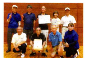
優勝 かしま台チーム

各種目での順位をもとに集計した総合得点の結果、優勝はかしま台チーム、第2位は寄居くまさんチーム、第3位は仲福田チームとなりました。委員長特別賞は応援団が駆け付けたチームUpが受賞しました。