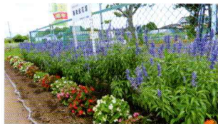
寄友会(寄居自治会)