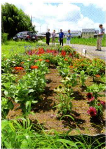
堀之内ガーデン会 (堀之内自治会)