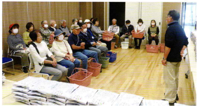
民生委員・児童委員の皆様へ感謝を述べる寺門副委員長

令和7年5月28日(水) ふれあいセンターすがやで、希望する一人暮らしの高齢者の皆様にお弁当を提供する第1回「ふれあい給食」(185食)を実施しました。