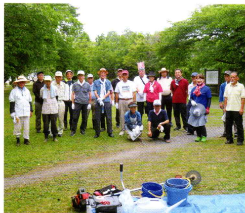
美化活動に参加された皆さん

令和7年7月5日(土)環境部会と各自治会役員の皆さま35名により宮の池公園南側及びその周辺の植栽樹木の手入れ、清掃活動を実施いたしました。