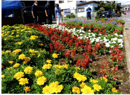
下宿上子ども会(下宿上自治会)