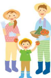
新たな担い手と つながる