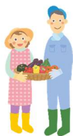
生産者同士が つながる

未来へつなぐ 作る喜び食べる喜び いい那珂農業 ～儲かる農業へのチャレンジで豊かないい那珂暮らしを実現～