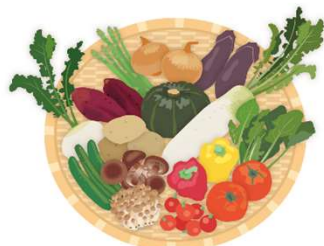
生産者と消費者が つながる