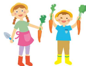
未来の担い手に つなぐ