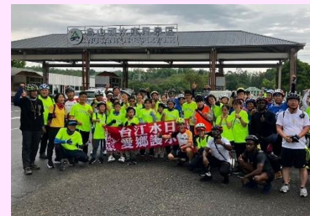
▲昨年度のサイクリイベントの様子