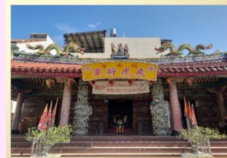
▲那珂市にゆかりのある「飛虎將軍廟」