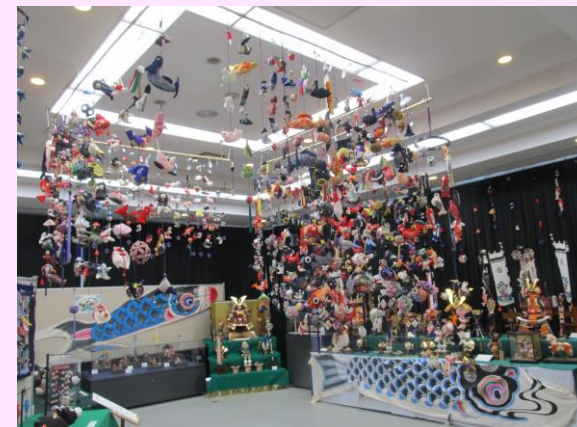
▲▼昨年度の「端午の節句展」の様子

なお、ご取材の際は会場の都合上、お手数ですが問い合わせ先までご連絡いただければ幸いです。