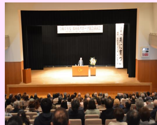
▲令和5年度講演会の様子