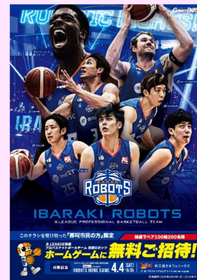
▲市内の全戸に配布したチラシ