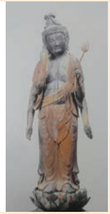
木造如意輪観音立像 ▶

各寺院の紹介および信仰の象徴である仏(仏像)に焦点を当て、常福寺の末寺であった銀山寺跡から平成30年度に発見された「聖観音菩薩立像」と、当館寄託の県指定文化財「木造如意輪観音立像」を展示します。