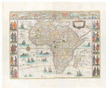
ウィレム・ブラウ、 ヨアン・ブラウ「大地図帳」 (公益財団法人東洋文庫蔵)