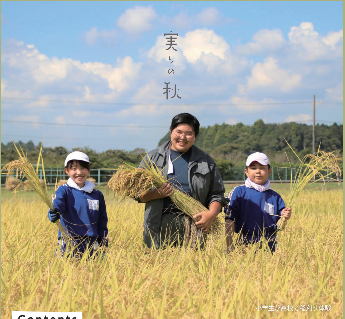
小学生が高校で稲刈り体験