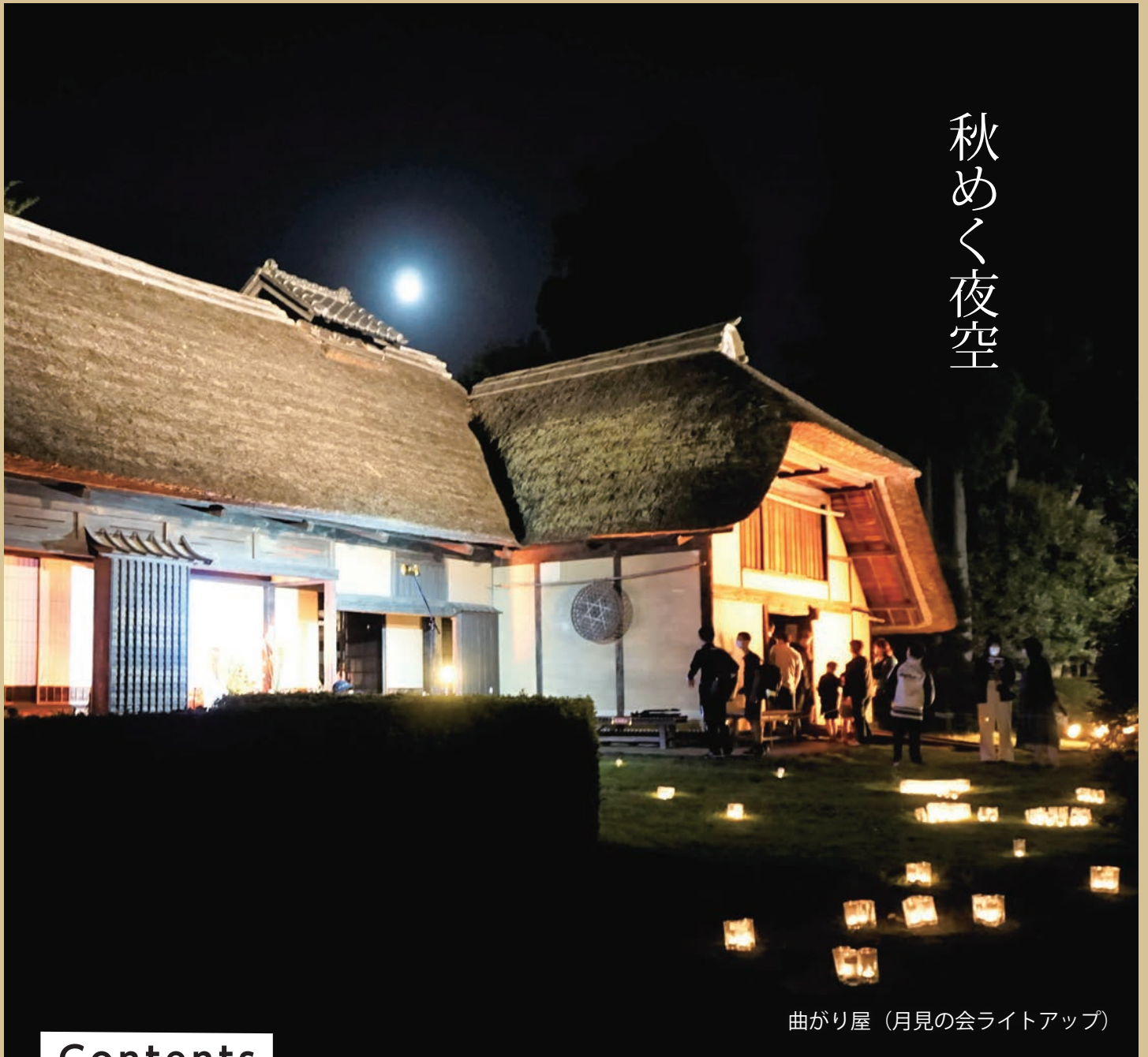
曲がり屋（月見の会ライトアップ）