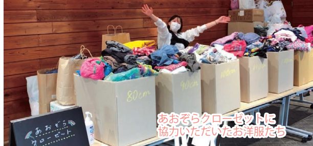
あおぞらクローゼットに協力いただいたお洋服たち