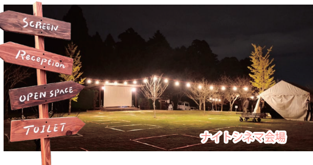
ナイトシネマ会場