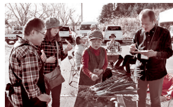
▲バーベキューではまるごと 焼いたネギのおいしさに驚き