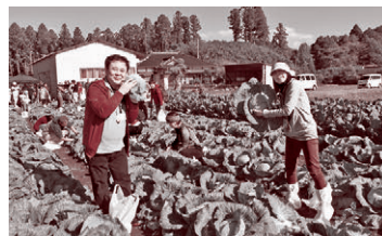
▲夏に植えたキャベツと ブロッコリーを収穫