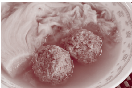
ヘルスメイトさんが作る健康料理 172