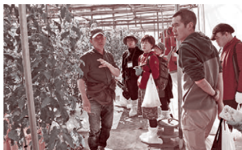
▲トマトの収穫体験と 大型ハウスの見学