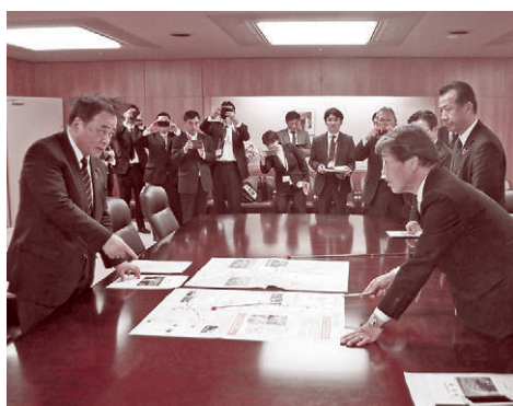
▲梶山経済産業大臣への要望