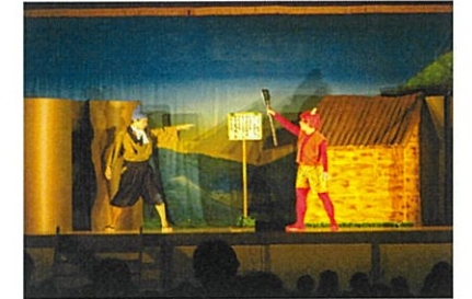
劇団「め組」による演劇 （もちの木まつり）