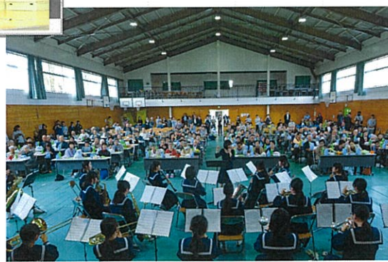
那珂二中・吹奏楽部による演奏