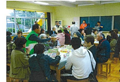
市民活動団体によるPR

10月19日（土）那珂市役所市民協働課と額田地区まちづくり委員会の共催により、額田小学校でのもちの木まつり（三世代交流）に併せ、無料でコーヒーとお菓子を楽しめる「協まち・カフェ」が開催されました。会場には、自治組織や市民活動団体の日頃の活動を紹介するポスターが展示され、たくさんの方が来場され大変盛況でした。