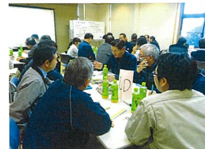
グループごとの話し合い