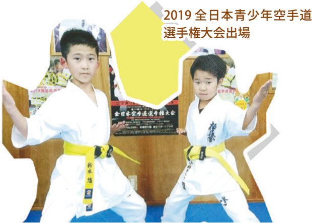
2019 全日本青少年空手道 選手権大会出場