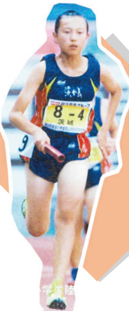
日清食品カップ第 35 回 全国小学生陸上競技交流大会 混合リレー出場