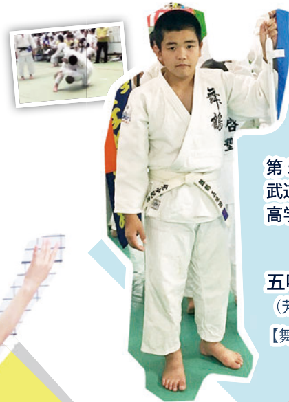
第 51 回全日本少年少女 武道錬成大会 (柔道競技) 高学年の部団体優勝