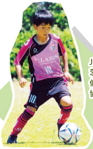
JA 共済 CUP2019 第 46 回 茨城県学年別少年サッカー大会 低学年の部第 3 位 (県サッカー 協会優秀選手賞受賞)