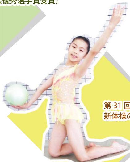
第 31 回茨城県ジュニア育成大会 新体操の部 5、6年ボールの部優勝