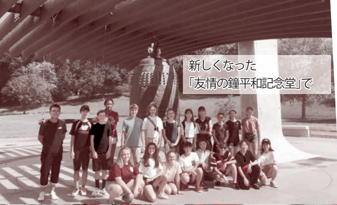
新しくなった 「友情の鐘平和記念堂」で