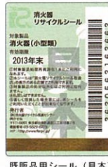
既製品用シール(見本)