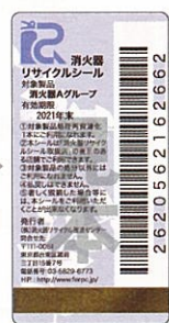
新品用シール(見本)

製品にはリサイクルシールが貼られています。耐用年数を過ぎたら、取扱い窓口へ引き渡してください。