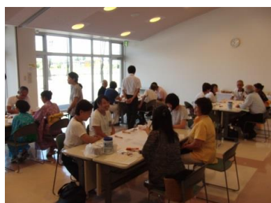
各テーブルでの話し合い