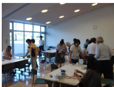
メンバーの組み替え