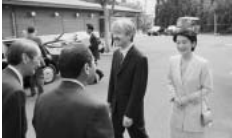
(左上) 両殿下のご臨席を仰ぎ水戸農業高校陸上競技場で大会開式が行われました。地元茨城県からは、水戸農業高校、江戸崎西高校、真壁高校が出場 (左中) 馬術競技場で、巧みな手綱さばきで障害をクリアする選手 (右上) 水戸農業高校子牛小屋で授乳する生徒に、飼育方法などについてご質問をされる両殿下 (右下) 県きのご博士館を視察し、マツタケ栽培の最新の成果について説明をお受けになる両殿下 (左下) 両殿下にお別れのごあいさつをする小宅那珂市長⑤、福田市議会議長⑥