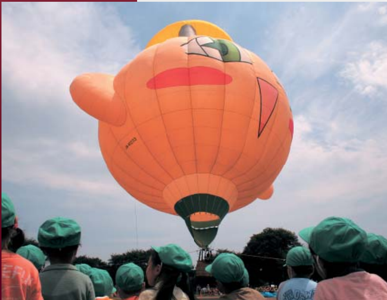
芳野小グラウンドで熱気球に歓声を上げる子どもたち