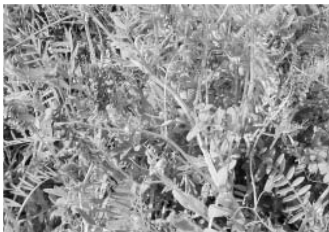
ヘアリーベッチ：マメ科の植物で、春先から初夏にかけて紫色の花を咲かせます。30～50cmに成長します

ヘアリーベッチは、春先から初夏にかけて紫色の花が咲き、ほ場を全面被覆して雑草を抑制し、最高気温が30℃になると一斉に枯れて敷き藁状になります。また、ヘアリーベッチの被覆は裸地に比べ、夏期は昼間の