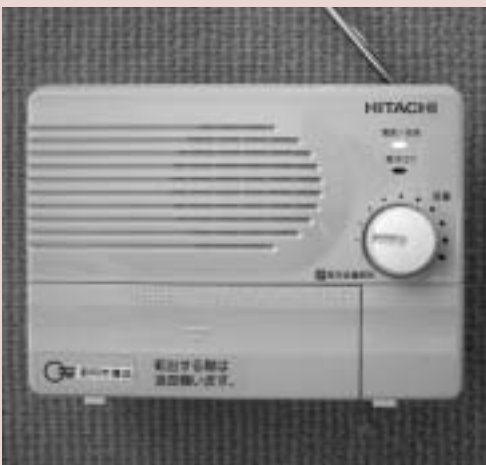
戸別受信機（旧那珂町タイプ）

現在は、防災無線という性格から、災害時の緊急事態に関すること及び人命にかかわる緊急事態、その他特に緊急重要な事項を基本にした運用により、本来の役割を發揮できるようにすることが大切であると考えています。