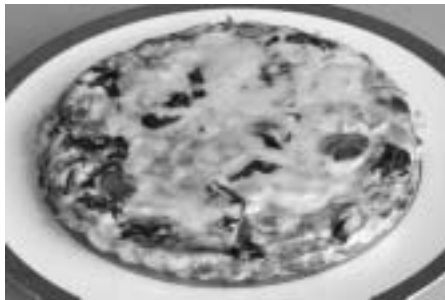
ヘルスメイトさんが作る健康料理④