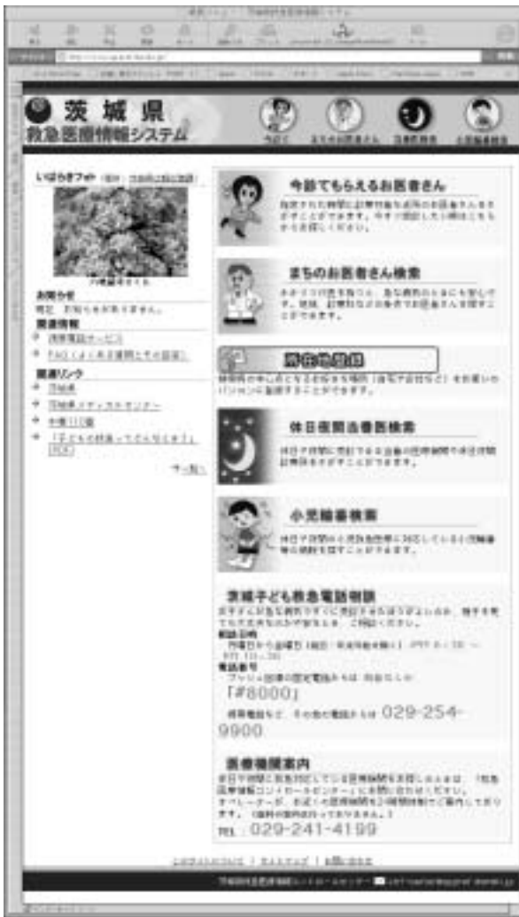
茨城県救急医療情報システムのホームページ