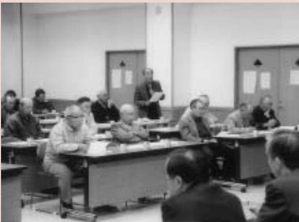
平成15年度の町政懇談会(旧那珂町)の様子