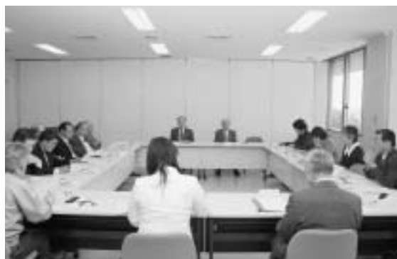
第1回那珂地区地域審議会の様子。今後各地域審議会でも様々な審議が行われます。