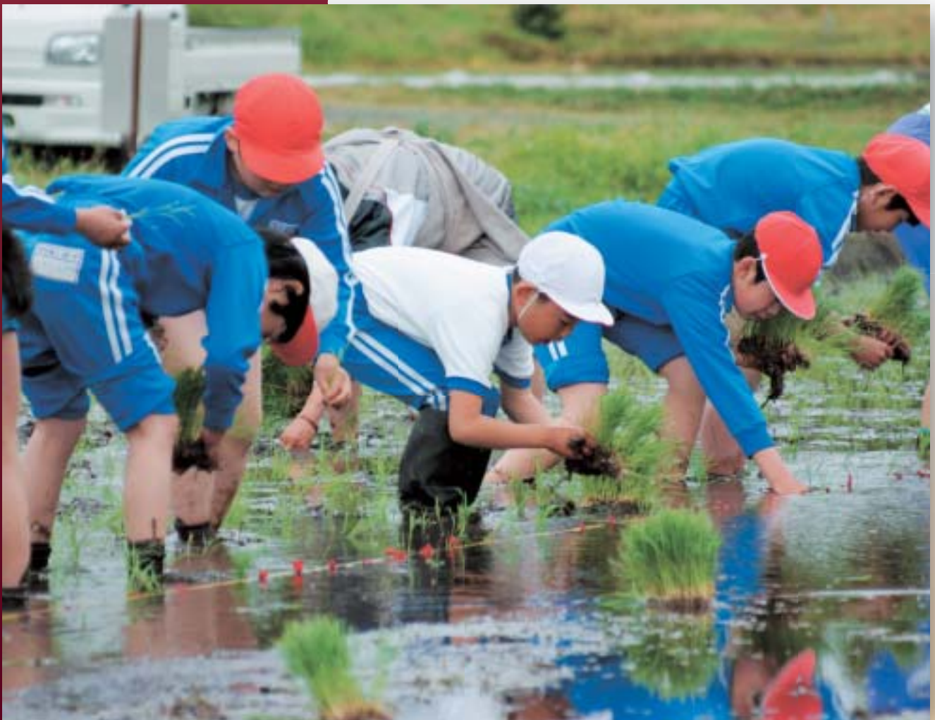
泥んこまみれで「田植え体験」(本米崎小児童)