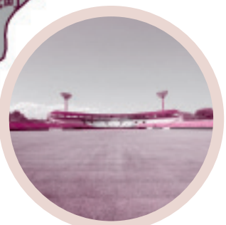
◆総合運動公園市民球場(水戸市)