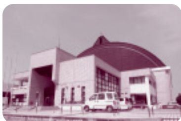
◆総合体育館(東海村)

※各施設の詳しい情報は、各市町村のホームページでご確認ください。東日本大震災の影響により、一部の施設では利用が制限されている場合があります。利用の際には、利用状況等について各施設にお問い合わせください。