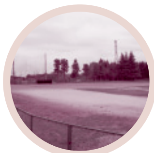
◆常北運動公園野球場(城里町)