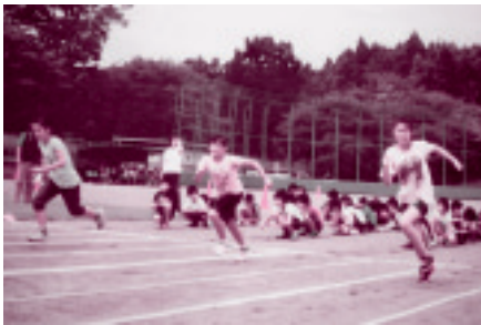
■かけっこ（陸上）教室