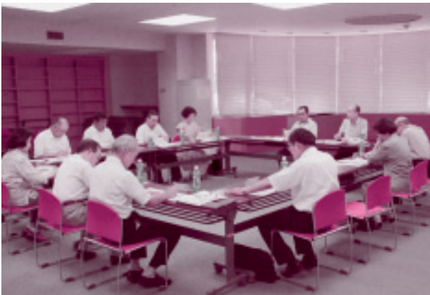
<行政改革懇談会の様子>

なお、財政健全化プラン推進計画の実施状況については、市のホームページ、図書館でご覧いただけます。