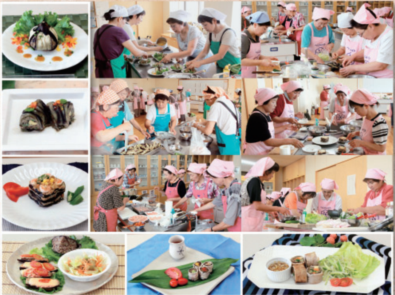
アイデアあふれるヘルシー料理（常陸大宮保健所管内料理コンクール）