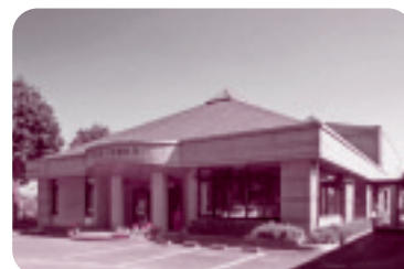
◆小川図書館(小美玉市)