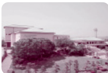
◆大洗文化センター(大洗町)