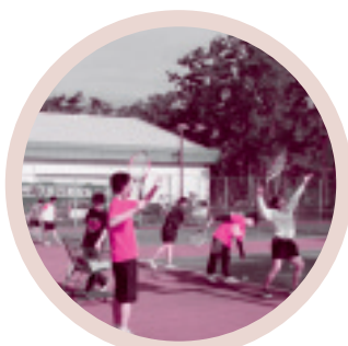
◆ビーチテニスクラブ(大洗町)