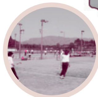
◆総合公園テニスコート(笠間市)