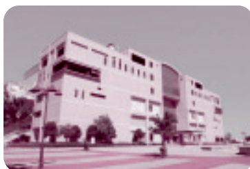
◆総合運動公園体育館(ひたちなか市)