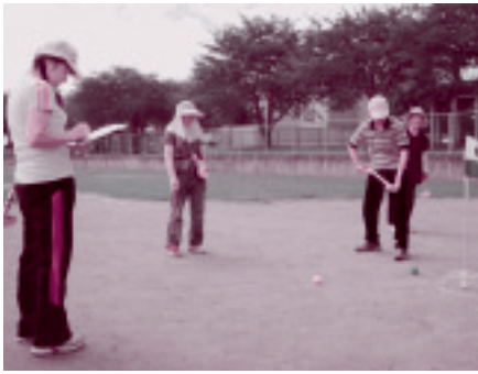
■グラウンド・ゴルフ