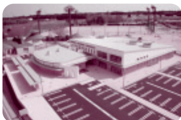
◆内原図書館(水戸市)