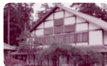
◆やすらぎの里小川（小美玉市）