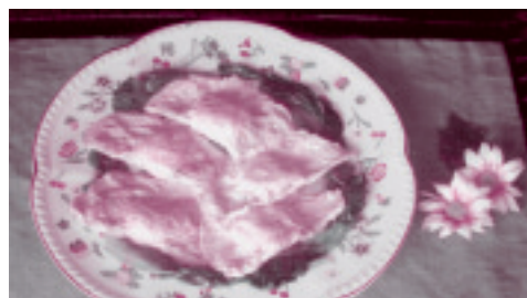
ヘルスメイトさんが作る健康料理③