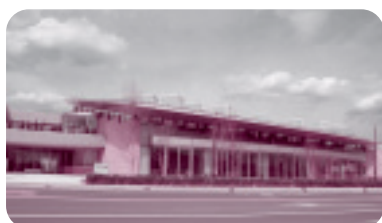
◆笠間図書館（笠間市）