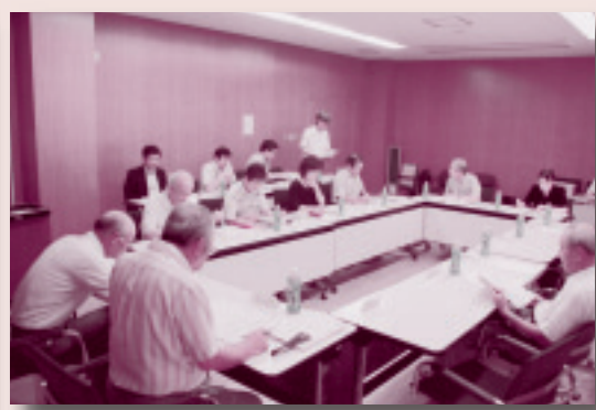
■瓜連地区地域審議会の様子