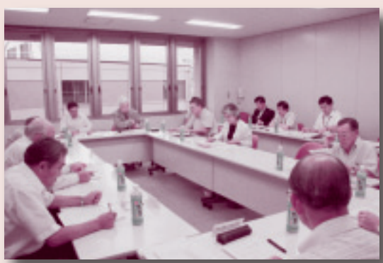
■那珂地区地域審議会の様子