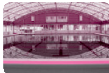
◆運動公園プール(茨城町)