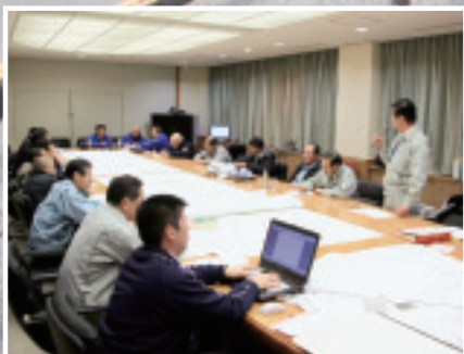
■那珂市災害対策本部

3月11日(金)、午後2時46分、那珂市を震度6強の地震が襲いました。市内では家屋や多くの石塀が倒壊したり、屋根瓦などが壊れ、また、ライフラインや道路・鉄道・公共施設なども大きな被害を受けました。これから復旧には長い時間を要しますが、地震から1か月が経過し、那珂市は復興に向けて着実に進んでいます。ご不便をお掛けしますが、どうかご理解をお願いします。