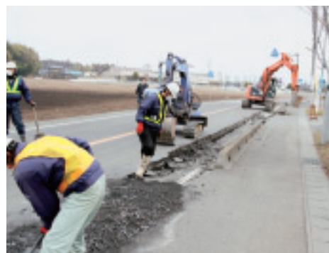
■復旧に向けて道路の亀裂・陥没を修理