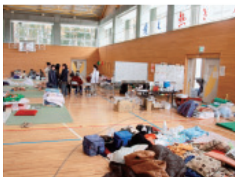
■避難所（瓜連中体育館）