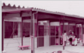
■完成した五台幼稚園（左）と、横堀幼稚園（右）の仮設園舎