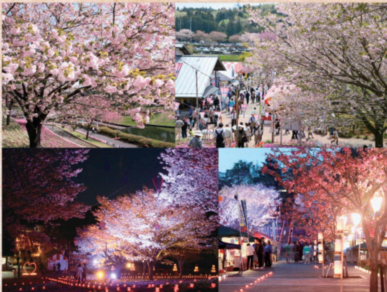
2つの顔を見せる八重桜（八重桜まつり）