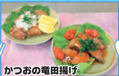
かつおの竜田揚げ